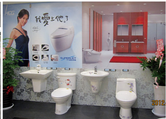
我愛上他了！是愛上馬桶還是愛上和成呢？和成廚藝生活館，以貼心的服務，俱全的產品，吸引您的目光...讓您不知不覺愛上他！