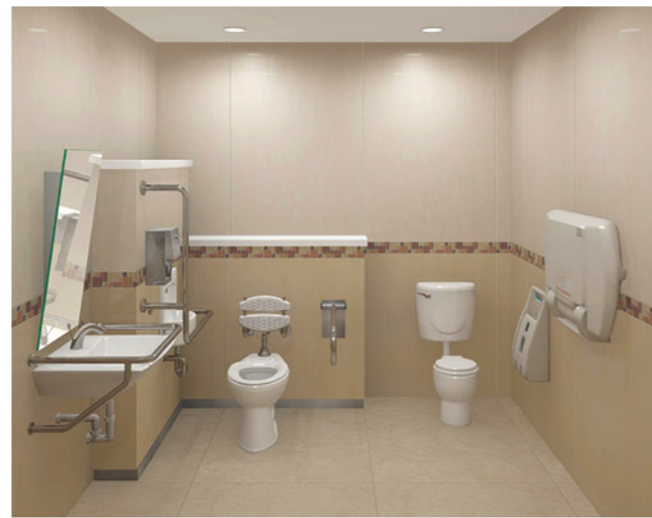
HCG 投入於公共設施無障礙社福產品示例