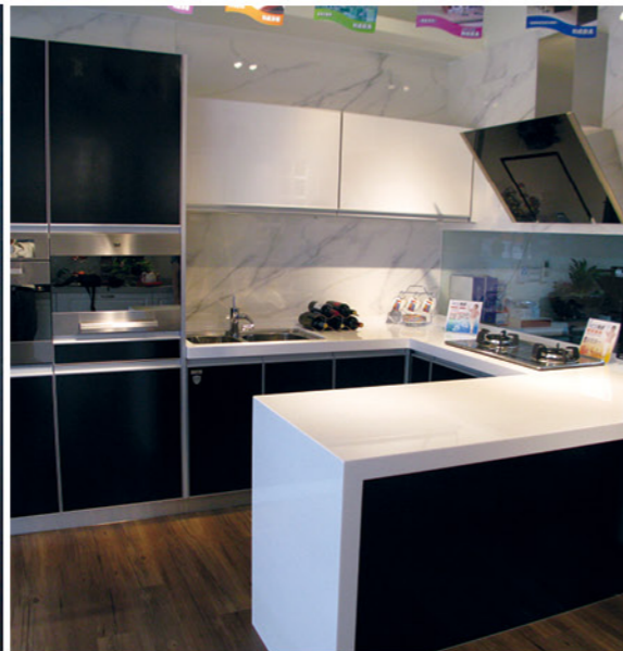
早期閉鎖的廚房正式開放融入居家空間，無界限的空間設計，又該如何利用樞樞的設計巧思，讓廚房機能與品味再度升級呢？來一趟和成廚藝生活館，打造屬於您的風格廚房吧！