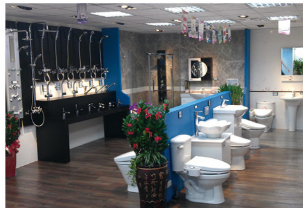
優質衛浴商品，除了講究品質也重視品味。和成廚藝生活館深知您對衛浴的要求，精選多款衛浴產品，讓您在規劃衛浴空間時選擇更多、更滿意。