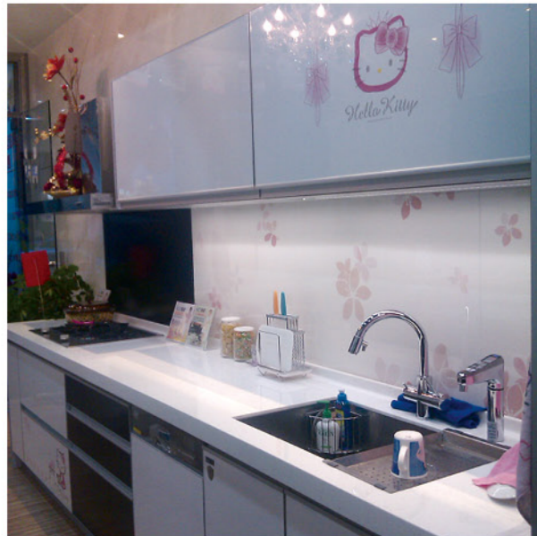
小廚房要變化，全球唯一 Hello Kitty 陶板廚具，融入純樸的生活中更顯溫馨可愛。(和成廚藝生活館 台中河南店)

走進廚藝生活館，您可以一邊感受喜愛的廚藝氛圍，一旁又有專業的廚衛專家為您配置符合品味的生活產品，因為每個人對廚衛空間的想像不同、需求也不同，所以和成廚藝生活館為您逐步量身打造出夢想廚衛空間。如此貼心專業的服務品質，更多產品都在和成廚藝生活館，竭誠歡迎蒞臨參觀，待您來感受和成的用心！