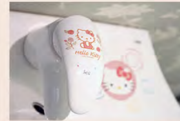
與Hello Kitty合作的系列，向來廣受小朋友的喜愛。