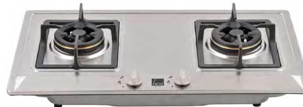
GS232 檯面式二口瓦斯爐

瞭解以上的結構以及選購指南後，是不是對瓦斯爐有了更進一步的認識了呢，再選購時依據家中的條件，換一個安全實用的瓦斯爐吧。