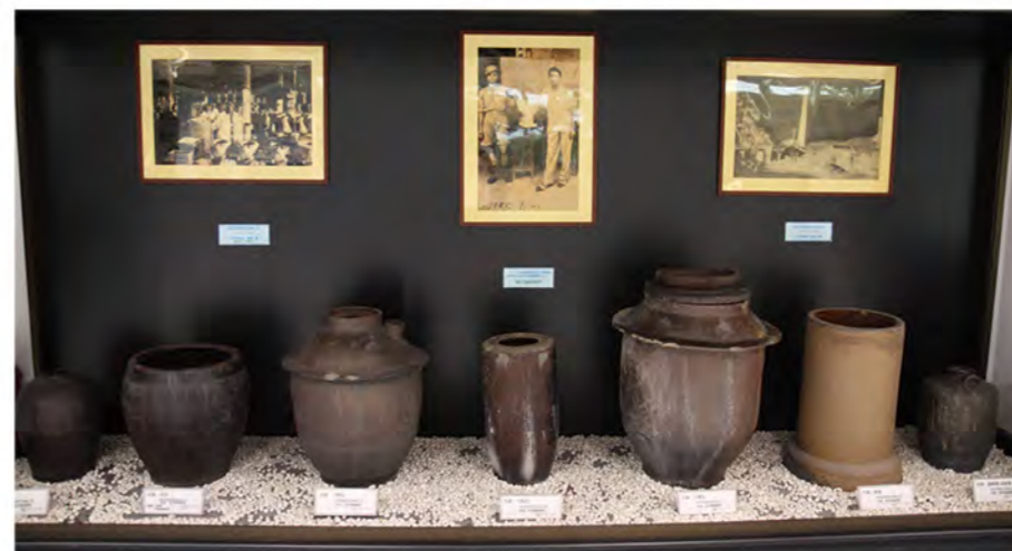
和成至今還保留著七十年前生產的醬缸，做為企業的精神象徵。