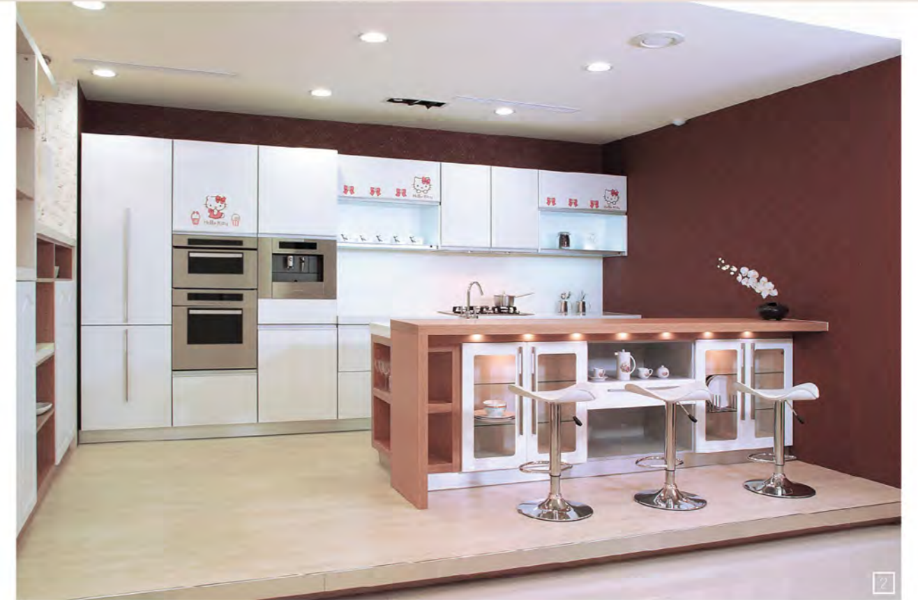
2 | Elegance 典雅健康廚房 微笑-LINE— Hello Kitty 微笑圖案，或坐或臥散發迷人風采，搭配典雅設計，融入純樸的生活之中，刻劃出的優美造型展現出新古典的風格。

全球唯一和成專售陶板廚具門板上嵌入CERABO陶板，是廚具業界裡獨一無二的產品，與市面上所銷售的鋼琴烤漆門板大大不同。