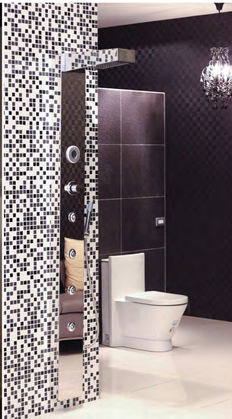
一套有設計感的衛浴設備，可以美化居家空間、增添生活氣氛。