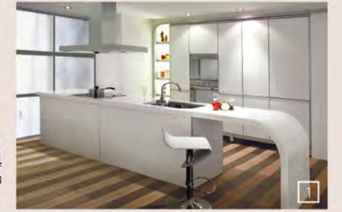
1 | Fashion 時尚健康廚房 CE-LINE— 採用1,150°C高溫釉燒陶板門板，搭配鋁質邊框顯現非凡質感，擁有高級烤漆門板的亮麗色彩，且陶板具有防污、抗菌、耐磨損、易清理等特性，為廚具革命性新產品。