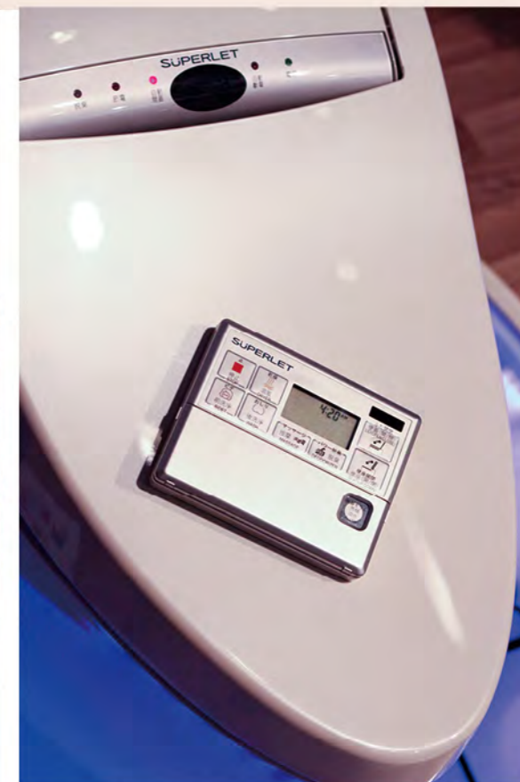
定價12萬元的智慧型超級馬桶，擁有無線遙控操作、自動掀開蓋、自動感應沖水等人性化功能。

每一天洗手洗澡、如廁解放都會使用到衛浴，但衛浴往往也是最不起眼、最容易被忽略的家庭設備。不過台灣有一家廠商，卻將衛浴設備當作科技精品來看待，不僅研發出定價12萬的智慧型超級馬桶，還請到天王劉德華、名模林志玲來幫自家馬桶代言—台灣衛浴龍頭HCG和成。創立於民國20年的和成，原本在日據時代只是一間生產醬缸、花瓶的小陶瓷廠，但是在台灣光復後，創辦人邱和成決定將工廠轉型為生產馬桶，也為和成開啟了另一片天。從民國70年以後，和成陸續推出香格里拉系列、阿爾卑斯系列、Legato系列等暢銷產品，逐步躍居台灣衛浴設備的第一品牌，目前和成在台灣的市占率高達5成以上，擁有近300家經銷商、25家生活館，並在全球擁有7座生產工廠。