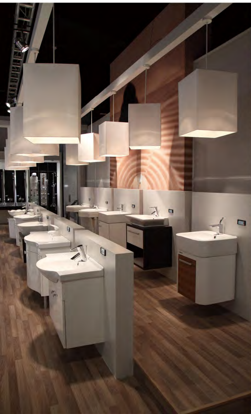
和成的衛浴設備擁有不輸高科技業的奈米抗污技術。